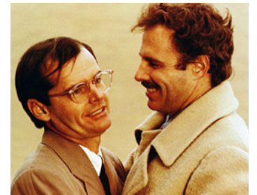
1972 THE KING OF MARVIN GARDENS de Bob Rafelson avec Bruce Dern