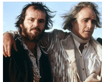
1976 MISSOURI BREAKS (The Missouri Breaks) d'Arthur Penn avec Marlon Brando