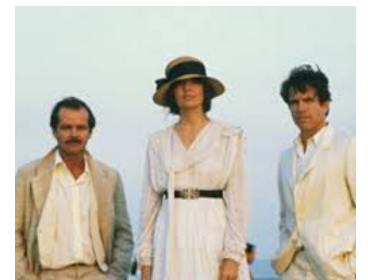
1981 REDS (Reds) de Warren Beatty avec Diane Keaton, Warren Beatty