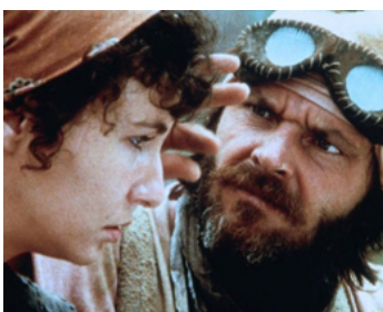
1978 EN ROUTE VERS LE SUD (Goin' South) de Jack Nicholson avec Mary Steenburgen