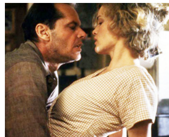
1981 LE FACTEUR SONNE TOUJOURS DEUX FOIS (The Postman always rings twice) de B. Rafelson avec J. Lange