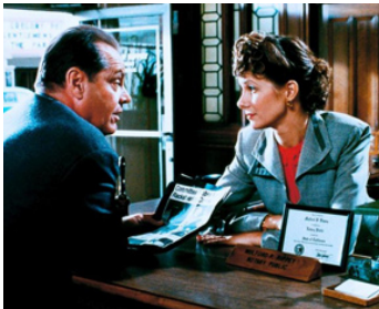
1990 THE TWO JAKES (The Two Jakes) de Jack Nicholson avec Susan Forristal