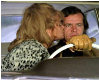
1970 CINQ PIÈCES FACILES (Five easy pieces) de Bob Rafelson avec Karen Black