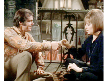
1970 MELINDA (On a clear day you can see forever) de Vincent Minnelli avec Barbra Streisand