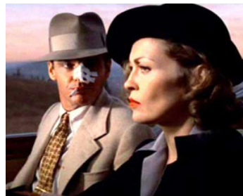
1974 CHINATOWN (Chinatown) de Roman Polanski avec Faye Dunaway