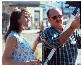
2001 THE PLEDGE (The Pledge) de Sean Penn avec Robin Wright Penn