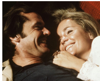
1971 UN COIN TRANQUILLE (A Safe Place) de Henry Jaglom avec Tuesday Weld