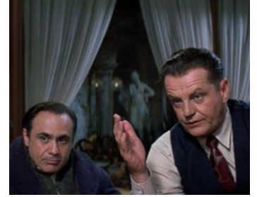
1992 HOFFA (Hoffa) de Danny De Vito avec Danny De Vito