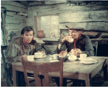
1965 L'OURAGAN DE LA VENGEANCE (Ride in the Whirlwind) de M. Hellman avec C. Mitchell