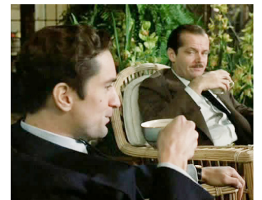
1976 LE DERNIER NABAB (The last Tycoon) d'Elia Kazan avec Robert De Niro