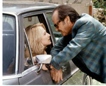
1992 MAN TROUBLE (Man Trouble) de Bob Rafelson avec Ellen Barkin