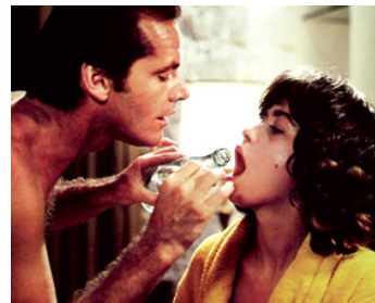
1975 PROFESSION REPORTER (Professione: reporter) de M. Antonioni avec Maria Schneider