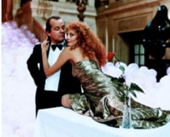
1987 LES SORCIÈRES D'EASTWICK (The Witches of Eastwick) de George Miller avec Susan Sarandon