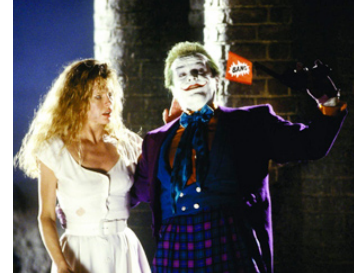
1989 BATMAN (Batman) de Tim Burton avec Kim Basinger