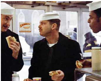
1973 LA DERNIÈRE CORVÉE (The Last Detail) d'Hal Ashby avec Otis Young, Randy Quaid