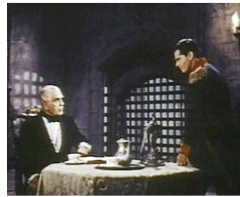
1963 L'HALLUCINÉ (The Terror) de Roger Corman avec Boris Karloff