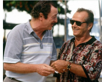
1996 BLOOD AND WINE (Blood and Wine) de Bob Rafelson avec Michael Caine