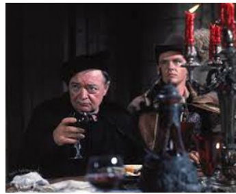
1963 LE CORBEAU (The Raven) de Roger Corman avec Peter Lorre