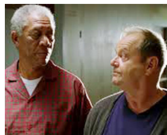
2008 SANS PLUS ATTENDRE (The Bucket's List) de Rob Reiner avec Morgan Freeman