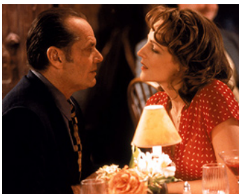
1997 POUR LE PIRE ET POUR LE MEILLEUR (As good as it gets) de J. L. Brooks avec Helen Hunt