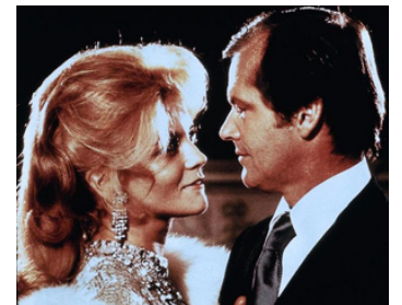
1975 TOMMY (Tommy) de Ken Russell avec Ann-Margret