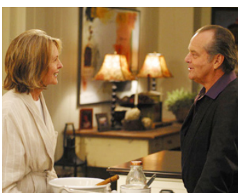
2003 TOUT PEUT ARRIVER (Something's gotta give) de Nancy Meyers avec Diane Keaton