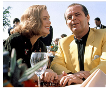
1985 L'HONNEUR DES PRIZZI (Prizzi's Honor) de John Huston avec Kathleen Russell