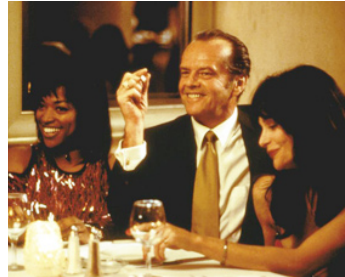
1995 CROSSING GUARD (The Crossing Guard) de Sean Penn avec Kellita Smith, Priscilla Barnes