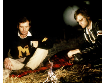
1969 EASY RIDER (Easy Rider) de Dennis Hopper avec Peter Fonda