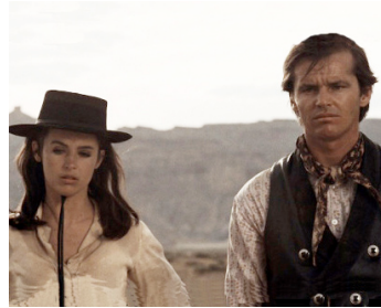
1967 THE SHOOTING (The Shooting) de Monte Hellman avec Millie Perkins