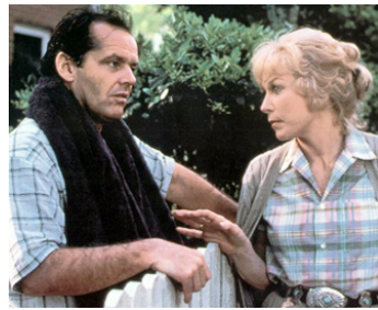
1983 TENDRES PASSIONS (Terms of Endearments) de James L. Brooks avec Shirley MacLaine