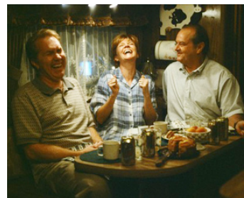
2002 MONSIEUR SCHMIDT (About Schmidt) d'A. Payne avec Harry Groener, Connie Ray