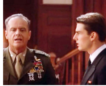
1992 DES HOMMES D'HONNEUR (A Few Good Men) de Rob Reiner avec Tom Cruise