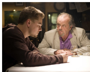
2006 LES INFILTRÉS (The Departed) de Martin Scorsese avec Leonardo Di Caprio