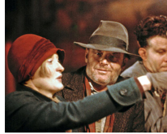
1987 IRONWEED (Ironweed) de Hector Babenco avec Meryl Streep