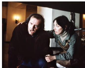
1980 SHINING (Shining) de Stanley Kubrick avec Shelley Duvall