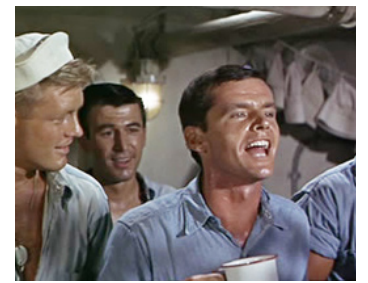
1964 ENSIGN PULVER de Joshua Logan avec Robert Walker Jr