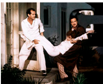
1975 LA BONNE FORTUNE (The Fortune) de M. Nichols avec Warren Beatty, Channing Stockard