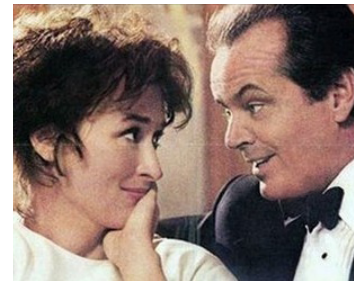
1986 LA BRÛLURE (Heartburn) de Mike Nichols avec Meryl Streep