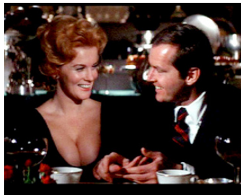
1971 CE PLAISIR QU'ON DIT CHARNEL (Carnal Knowledge) de M. Nichols avec Ann-Margret