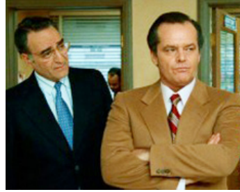
1987 BROADCAST NEWS (Broadcast News) de James L. Brooks avec Robert Katims