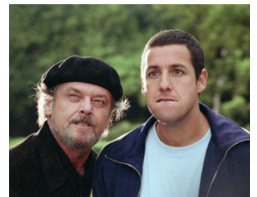
2003 SELF CONTROL (Anger Management) de Peter Segal avec Adam Sandler