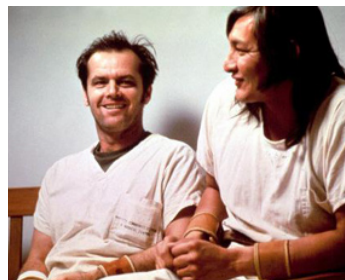
1975 VOL AU-DESSUS D'UN NID DE COUCOUS (One Flew over the Cuckoo's Nest) de M. Forman avec Will Sampson